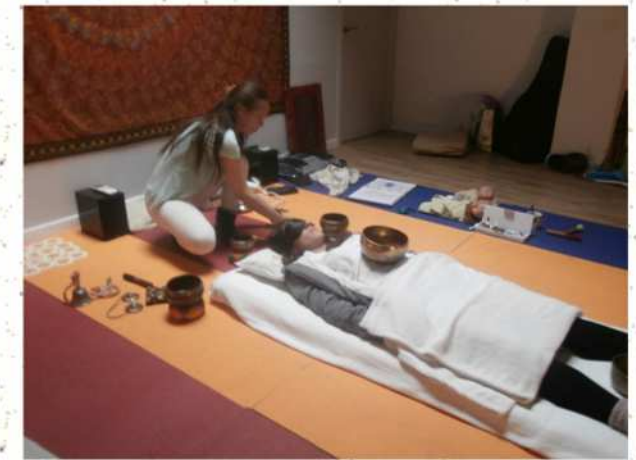
Sesión Masaje Sonoro con Cuencos

Formada en Musicoterapia y Terapia del Sonido. Escuela Tama-Do, y Asociación internacional de Terapia del Sonido en Alcalalí (Alicante) Instructora de Hatha Yoga y Pilates Formada en danzas Indias Maestría en Reiki. Masaje y Terapia Ayurveda. Shantala y Belleza Kinesiología TFH Sistema Floral Australiano Estudios Chamánicos